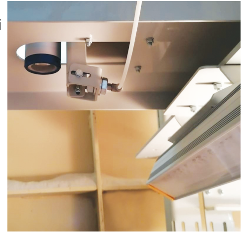
Camera | Illuminatore LED

La percentuale di umidità è valorizzata attraverso la spettrografia NIR nel vicino infrarosso con sonda in fibra ottica, mentre la curva granulometrica è misurata attraverso una camera ad alta risoluzione. I sistemi illuminanti dedicati consistono rispettivamente in due illuminatori lineari alogeni posti in parallelo tra loro e due barre led a luce bianca poste in parallelo tra loro.