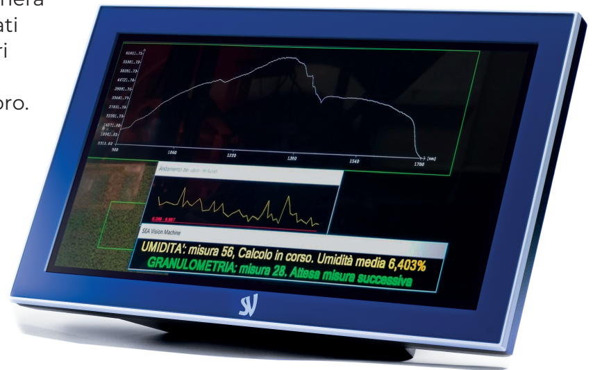
HMI - Display Touch Screen