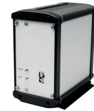
Spettrometro a fibra ottica

La correttezza dei sistemi di misurazione è supportata da puntuali calibrazioni della strumentazione utilizzata, le cui procedure sono indicate e descritte nel manuale di utilizzo.