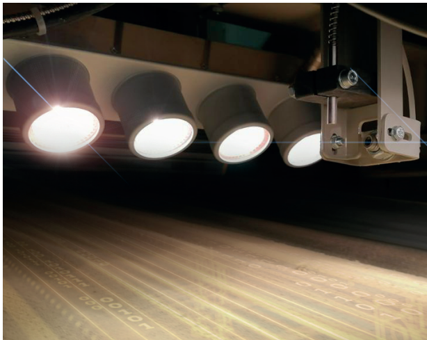
Sensore in fibra ottica | Illuminatore alogeno